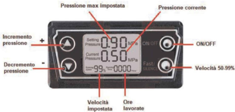
Vista del pannello di controllo con display LCD

Una volta inserita la spina del cavo di alimentazione nella presa di corrente idonea, l'apparecchio è pronto per lavorare; il pannello LCD si illumina parzialmente, anche a motore spento.