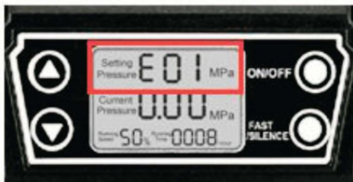
Vista del pannello di controllo con display LCD

In condizioni di funzionamento anomale, il compressore si spegne automaticamente mostrando nel display uno degli errori elencati alla pagina seguente.